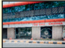
Krishna AC Hall